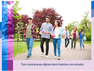
Tüm uluslararası öğrencilerin katılımı zorunludur.

Kapadokya Üniversitesi Uluslararası Öğrenci Birimi tarafından 2023 yılında düzenlenen bilgilendirme toplantısı, üniversitemizde eğitim gören uluslararası öğrencilere yönelik olarak gerçekleştirilmiştir.